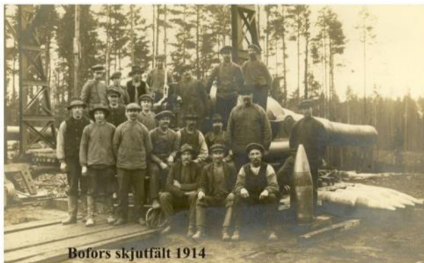
Bofors skjutfält 1914